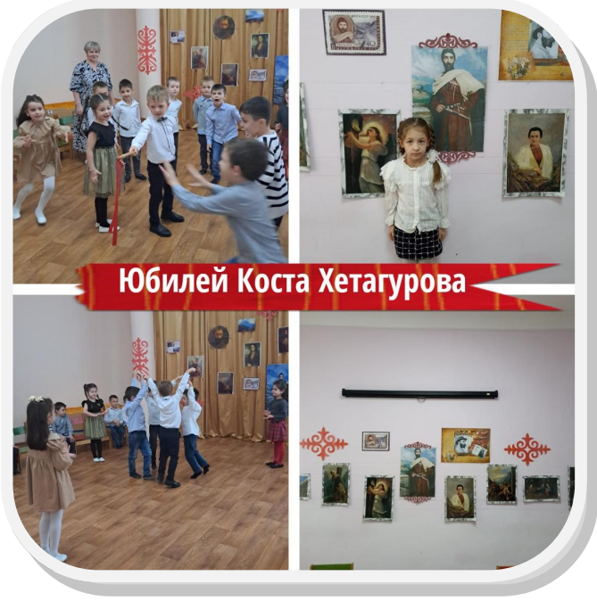
Юбилей Коста Хетагурова