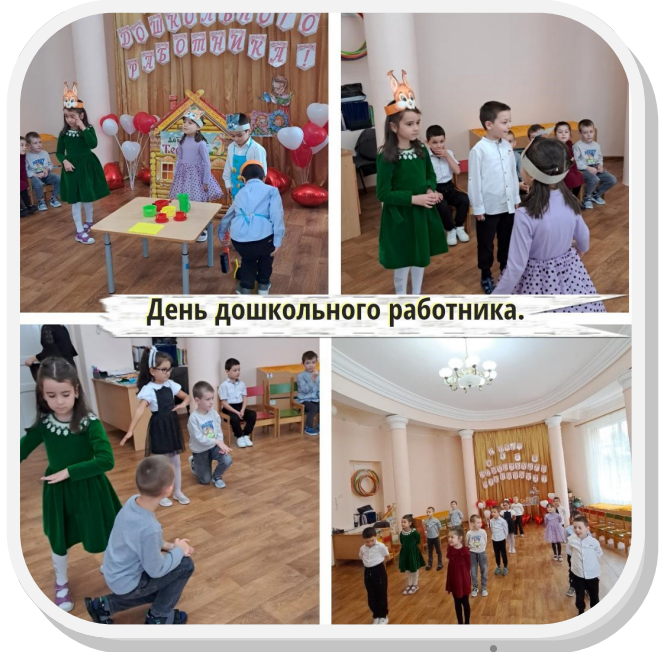
День дошкольного работника.