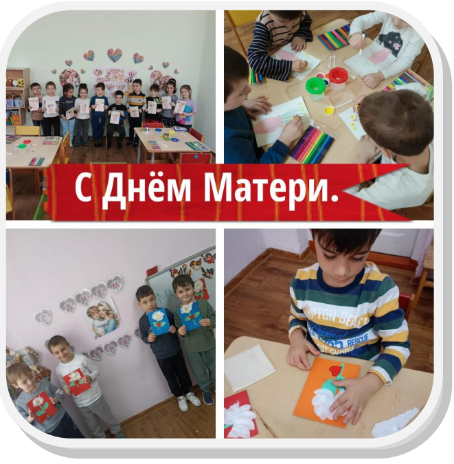
С Днём Матери.